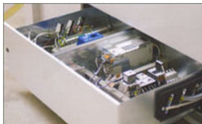
All elektronik på ett ställe för snabb service