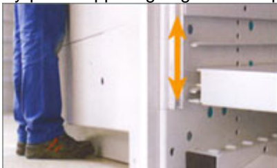
Bättre plats för huvud & fötter och anpassad plockhöjd

Tack vare Megalift FSE's stabila ramkonstruktion kan maskinen hantera laster på upp till 70 ton som standard på ett säkert sätt. Konstruktionen tillåter upp till 6 portöppningar i fri höjd, fördelat på fram och/eller baksidan. Megalift FSE har även en fyrapunktsupphängning av arbetsplattan, och den centrala styrningen gör att den tål ojämn belastning.