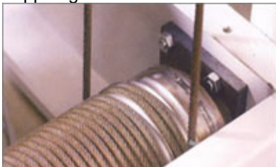
Tyst & snabbgående vajerdrift

Vertikal förflyttning av godset sker snabbt, smidigt och säkert genom beprövat vajerteknik. Vajerstyrda system har använts i århundraden. De är kända för att kunna hantera tunga laster med hög frekvens, de är slitstarka och har lång livslängd. Den horisontella drivningen sker genom en vevrörelse som flyttar lastbäraren ut och in i plocköppningen.