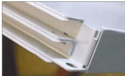
Bärskena med 25 mm's avstånd