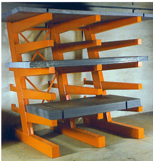
Plåtställ för hela plåtpaket á 2400 kg i storlek 1000 x 2000, 1250 x 2500 och 1500 x 3000 mm. Det finns plats för sex paket med plåtar. Kan även levereras i andra storlekar.

Vid förvaring av obrutna plåtpaket fordras kraftiga grenställ. Armarna kan placeras valfritt i höjdlid och även stolparna kan anpassas individuellt efter eget önskemål.