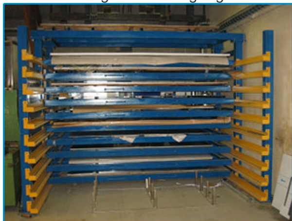
Utdragsenhet i stängt läge

För förvaring av hela paket av skivor eller plåtar rekommenderas utdragsenheter. När materialet kommer från leverantören placeras hela paketet direkt in i ställets fack. Från facket är det sedan lätt att med pneumatisk lyfthjälp plocka ut de skivor man behöver. Stället har en kapacitet på upp till 25 ton.