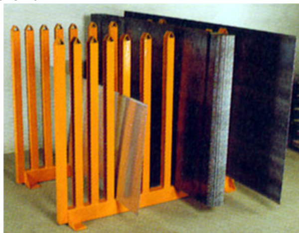
Skivställ MODELL B, här med 10 fack (varav 3 för skivpaket.

Höjd: 1200 mm, Bredd 1500 mm. Modell B kan utformas efter önskemål.