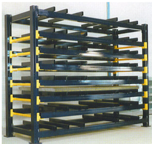
Plåtställ dimensionerat för plåtar på upp till 2400 kg i storlekarna 1000 x 2000, 1250 x 2500 och 1500 x 3000 mm. Plåtarna ligger på stålballar som kan flyttas 50 mm i höjdlid. Kan även levereras i andra storlekar.

Skivställ Modell A lämpar för lagring av olika lättare skivor medan Modell B passar bättre för alla typer av skivor och hela skiv/plåtpaket.