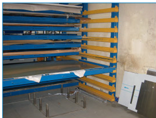
Utdragsenhet i öppet läge